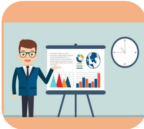
การนำเสนอ (Presentation)