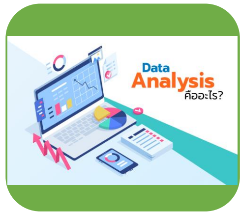
การวิเคราะห์ข้อมูล (data analysis)