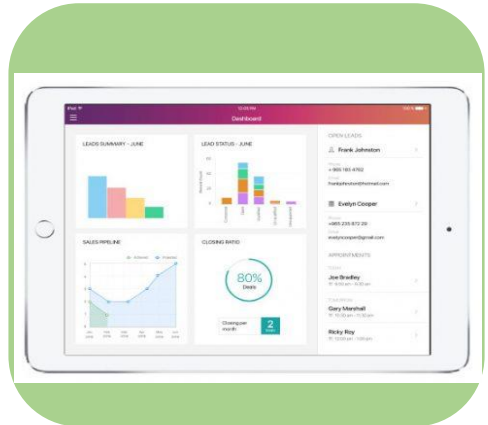
การสรุปผล (Summary)