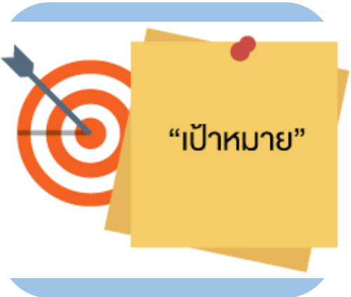
ได้ระบบสารสนเทศ MIS เพื่อในการบริหารจัดการข้อมูลของการประเมิน Core Business Enablers ในปี 2565