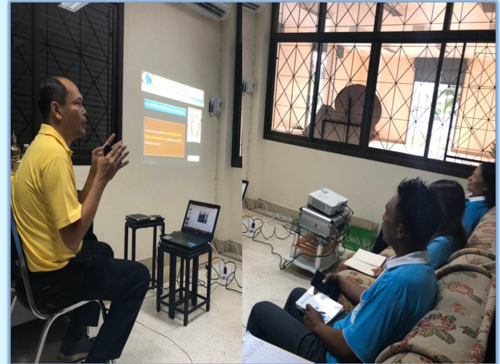
จัดการอบรมการบริหารความต่อเนื่องทางธุรกิจ

ณ สคจ.ชุมพร สคจ.กาญจนบุรี สคจ.เพชรบุรี สคจ.ประจวบคีรีขันธ์ และกองบริหารภูมิภาคเขต 7