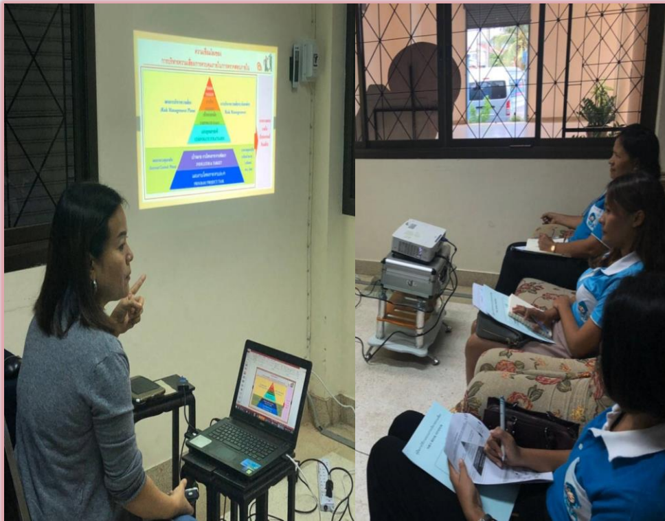
จัดการอบรมการบริหารการควบคุมภายใน