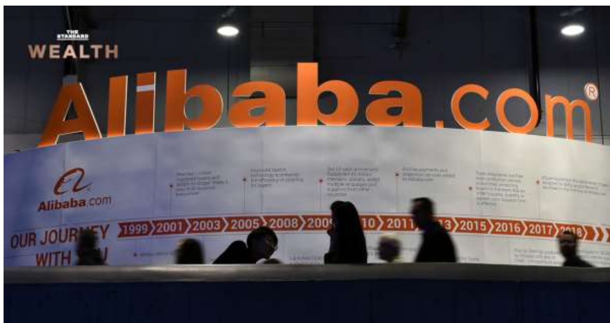
ที่มา : The Standard

เทคนจีน มีอนาคตหรือไม่ หลังพีใหญ่ อาลีบาบา ถูกบีบให้ต้องจำใจยุติแผนสปिनออฟธุรกิจคลาวด์ของตัวเอง